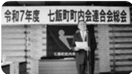
町内会連合会総会