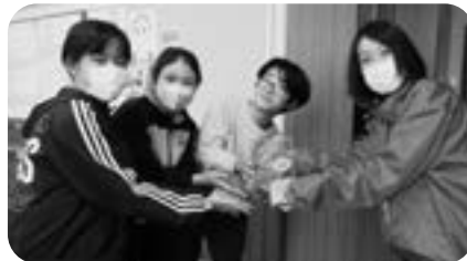
峠下小学校共同募金寄贈式