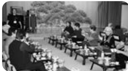
単身高齢者交流会 (本町地区)