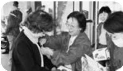
赤い羽根共同募金大中山文化祭

七飯町社会福祉協議会は、法人部門及び介護部門と相互連携を十分に図り、地域に密着した社協らしい事業展開をおこない、「信頼され期待される七飯社協」を目指します。