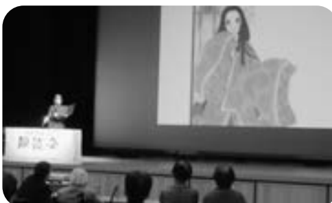
あゆみの会朗読会