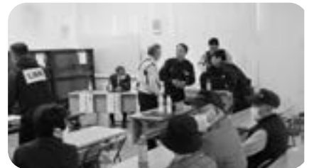
大沼親交会避難訓練