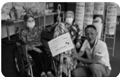
あかまつの里千羽鶴寄贈

令和8年度も社協は地域福祉を推し進めるため町内会活動、ボランティア活動、介護予防事業、災害対策、社会参加、子育て支援、介護事業といった幅広い事業を地域の方の理解と協力のもと進め、地域のために法人部門と介護部門がお互いに連携を図りながら事業を展開し、「いくつになっても安心して暮らせるまち」を目指してまいります。