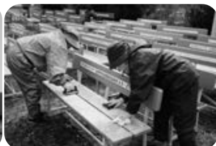
ふれあいベンチ清掃