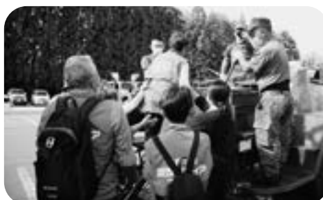
駒ヶ岳噴火住民避難訓練