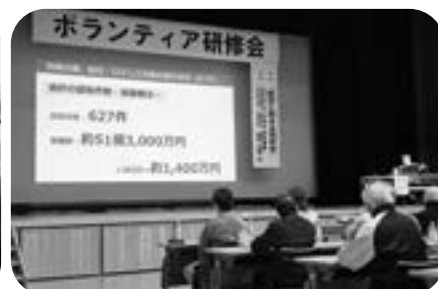
ボランティア研修会 (防犯)