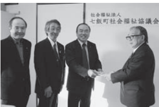
七飯ロータリークラブ様

皆様方からの心からの善意が昨年9月19日から今年1月23日まで、総額241,920円となりました。ご寄付いただいた皆様、本当にありがとうございました。