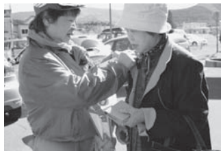
大沼文化祭街頭募金