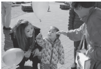
大沼グレートラン

望ヶ丘医院、(株)中川石油、新函館農業協同組合大中山支店、富原商店、そば処ふでむら、大中山出張所、大中山コモン、アップル温泉、好日園、大沼国際交流プラザ、セブンイレブン大沼店、大沼出張所、大沼婦人会館、新函館農業協同組合大沼支店、ローソン七飯町西大沼店、ハセガワストア藤城店、フェニックスコート、あかまつ調剤薬局、(株)ツルハドラッグ七飯店、七飯町役場、七飯郵便局、セブンイレブン渡島七飯店、ゆうひの館、老健あかまつの里ななえ、ななえ新病院、つぼ八七飯店、カラオケルームトマト、函館信用金庫七飯支店、新函館農業協同組合七飯支店、社会福祉協議会