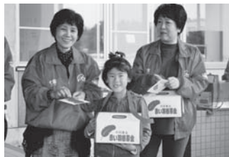
大中山文化祭街頭募金