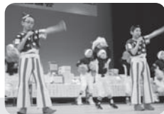
町長特別賞 七小野球スポーツ少年団 さん 曲目/ヤングマン(西城秀樹)