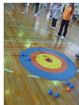
スプラッシュボール