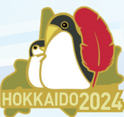
北海道ペンギン親子