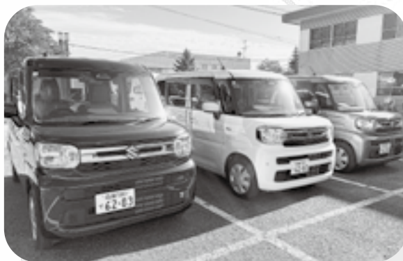
7月から支援車が変わりました。

昨今、物価高騰によりガソリン等の値上がり、サポーター会員の方々に負担をおかけしてきました。誠に不本意でございますが、謝礼金の改定を実施させていただきますのでご理解ご協力をお願い致します。