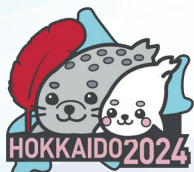
北海道アザラシ親子