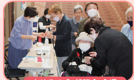
あゆみの会 朗読会 会場