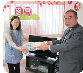
高齢者施設にお届けしました！

コロナ禍においても自分たちにできることを・なにかお役に立てられたら、という思いをもって素敵な企画をしてくださりありがとうございます。この温かいご寄付は町内の高齢者施設に送られ、利用者さんたちに大いに喜ばれました。