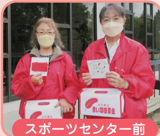
スポーツセンター前