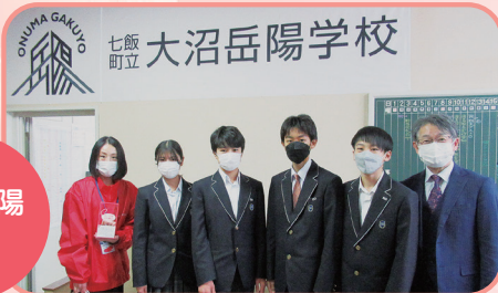
ONUMA GAKKO 七飯町立 大沼岳陽学校