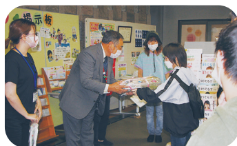
寄宿舎生一同が地域センターにお越しくださいました！

七飯養護学校の寄宿舎生たちが一つ一つ手作りしてくれた、ミシン縫いの雑巾・折り紙のコマ・自分で染めた和紙を貼ったうちわ・カードを30セット、七飯町社会福祉協議会に寄付していただきました。