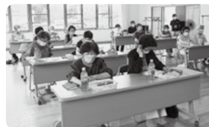
30cmのプラスチックのざるは何色の袋で出しますか？