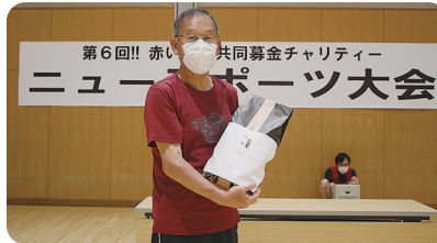
大中山地区 優勝者