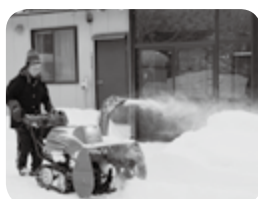
昨シーズンの活動の様子

貸し出しは審査により、決定致しますので、詳しくは、社会福祉協議会まで、お問い合わせ下さい。