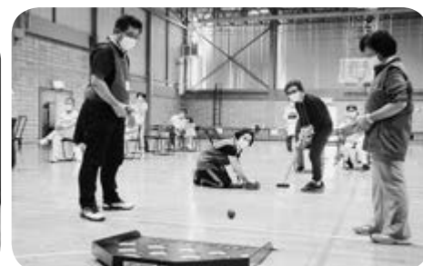
スポーツセンター