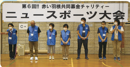
ボランティアさん