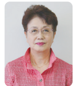
七飯町社会福祉協議会