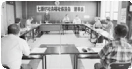
七飯町社会福祉協議会理事会