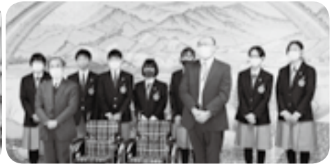
大中山中学校車イス寄贈