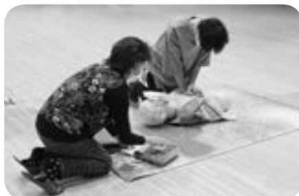
生活支援ボランティア救命講習