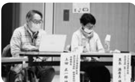
社協職員研修「メンタルヘルスと虐待防止」