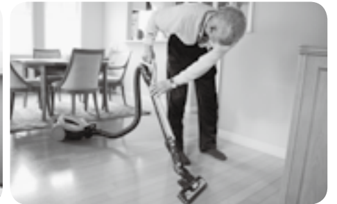
生活支援ボランティア家事援助

介護部門では、コロナ禍の中、感染予防に配慮し支援を行っていき、特に社協でなければ対応できないケースもあることから、日々研修や実技を行い質の高いサービスの提供ができるように心掛けていきます。また、常に施設を利用している利用者様等に対して「安心・安全」を優先に考え、更に利用者の増員も視野に入れて業務を行ってまいります。