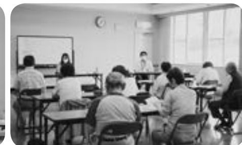
本町駅前町内会介護健康予防教室

介護部門においては、今年度もそれぞれの部署において職員が研修会への参加や自主努力を行い、新型コロナウイルス感染症の対策を講じて業務を行い、大きな事故もなく利用者に寄り添った「ぬくもりのあるサービス」の提供ができましたがサービス利用の自粛もあり収益が減収となりました。