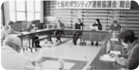
七飯町ボランティア連絡協議会総会

新型コロナウイルス感染症により町民の暮らしは一変し、社会は大きく変化するなどその甚大な影響は今も続いております。社協は住民とともに進めてきた小地域福祉活動や住民参加型在宅福祉サービスを実践しながら、町から委託を受けている、支え合い事業や生活支援サポート事業及び地域介護予防活動推進事業に力点を置き、福祉課題や生活課題の解決に向けて即応できる体制を強化し、これからも地域福祉を担う社協として「町民がいくつになっても安心して暮らせる街」をめざして、行政・町内会・民生委員や福祉団体等と連携を図り、地域福祉の向上に努めてまいります。