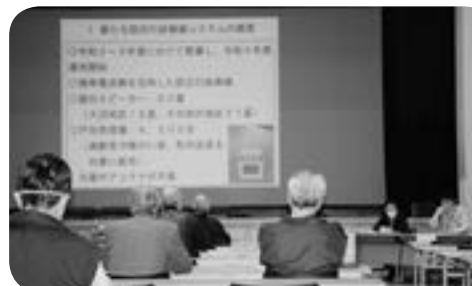
町内会長会議 防災について