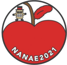
だんしゃ君 「西洋りんご発祥の地」