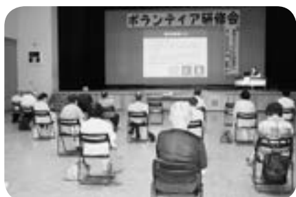
コロナウイルスについて学びました

また、活動者には研修や課題解決の参考になるように意見交換の機会を作り質の良いサービスの提供を心がけてきました。