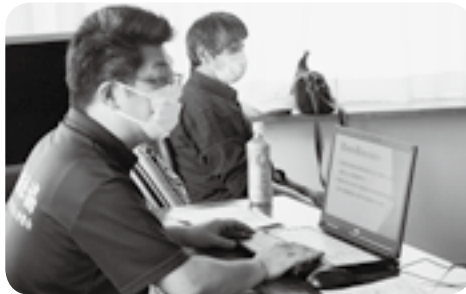
大中山中央町内会福祉懇談会