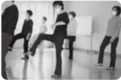
ディスコ「フレンド」