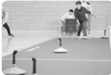
「七飯ユニカール愛好会」