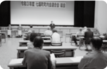
七飯町町内会連合会総会