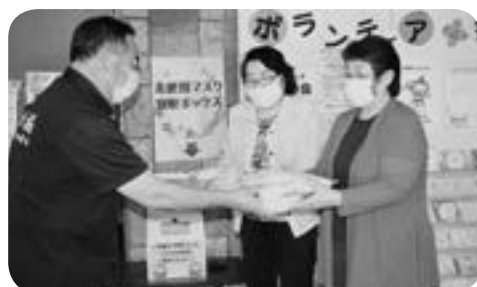
地域の団体からマスクの寄贈