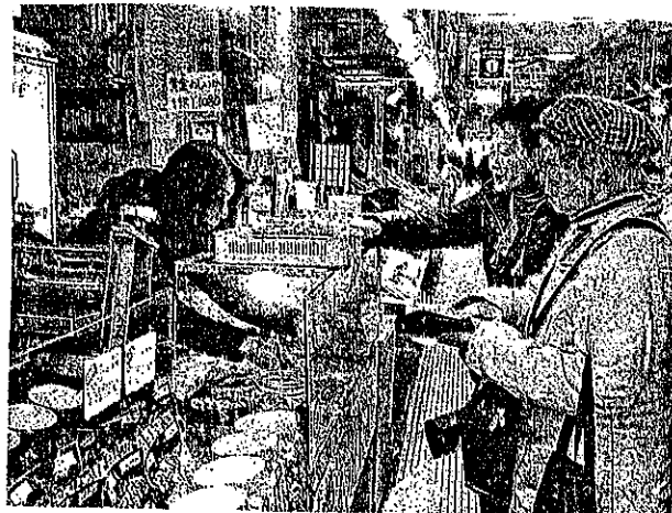
函館朝市内でお買い物を楽しむポイント制 実証実験の参加者