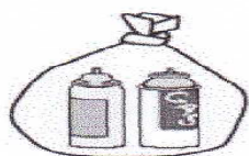
「完全に使い切ったスプレー缶・カセット式ガスボンベ」 ※中の見える袋