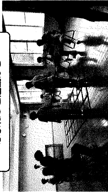
ふまねっと運動から

約50cm四方のマス目のできた大きな「あみ」を床に敷いて、その「あみ」を踏まないように、手拍子のリズムに合わせて歩く運動です。この動作によってバランスが改善され、脳が活発に動き認知機能が改善されると考えられています。