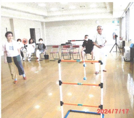
写真左；ラダーゲッターゲーム