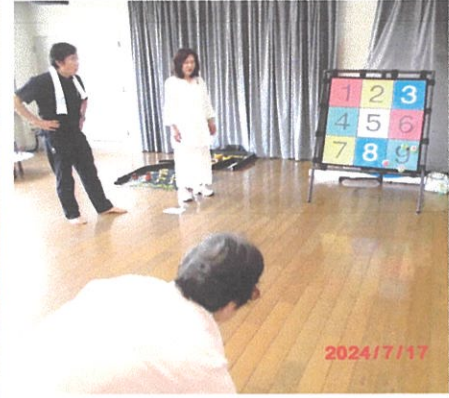
写真右；ターゲットゲーム