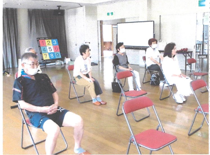
写真右；講話を聴く参加者の皆さん