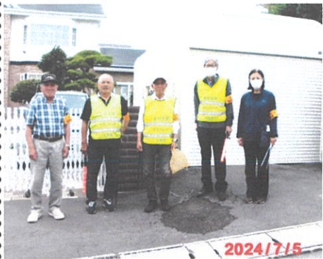
(写真は7月5日のパトロール参加者) ださい。