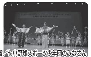
社協会長特別賞 / 七小野球スポーツ少年団のみなさん