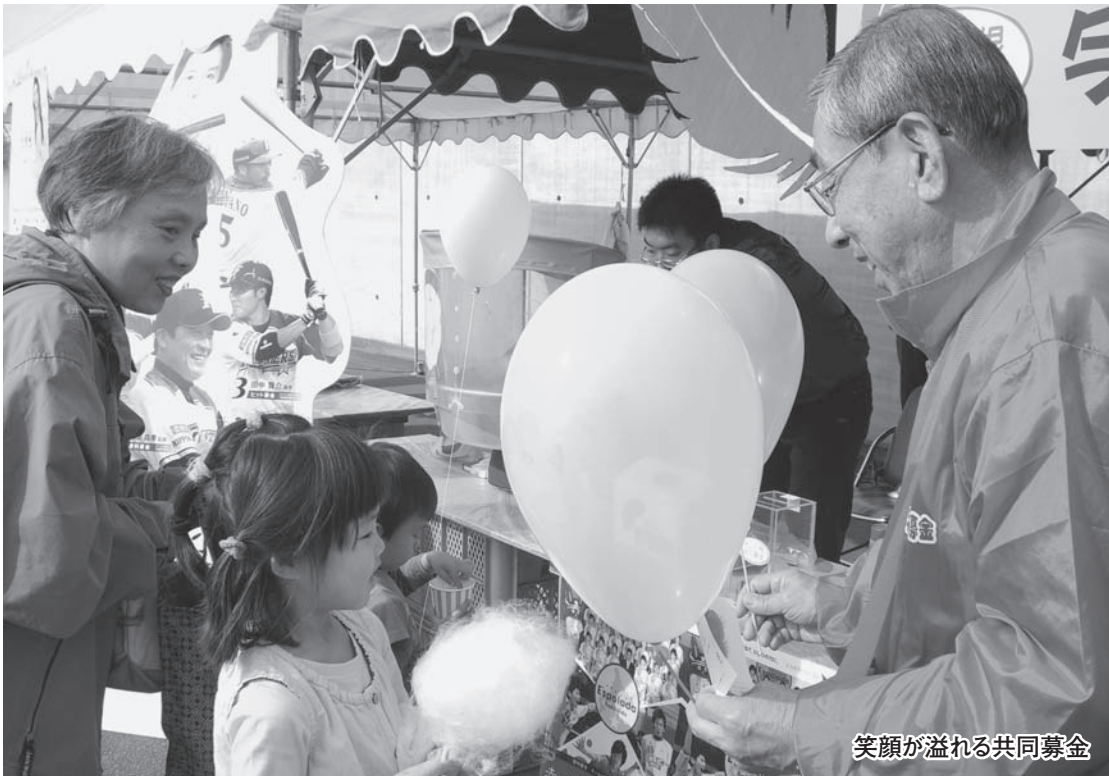
笑顔が溢れる共同募金