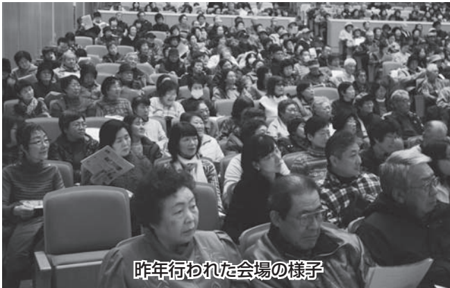
昨年行われた会場の様子