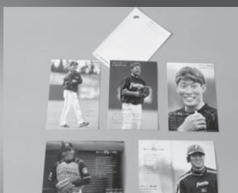
ポストカード 100円以上の募金で1枚