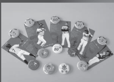
缶バッチ 200円以上の募金で1コ